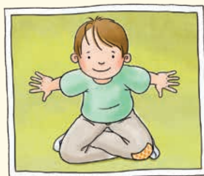
Obersicht / Vogelperspektive