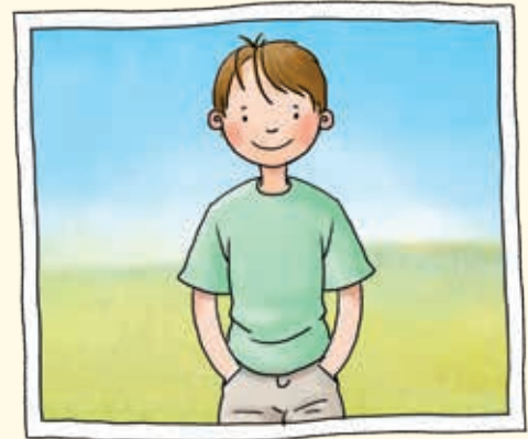
Normalsicht / auf Augenhöhe