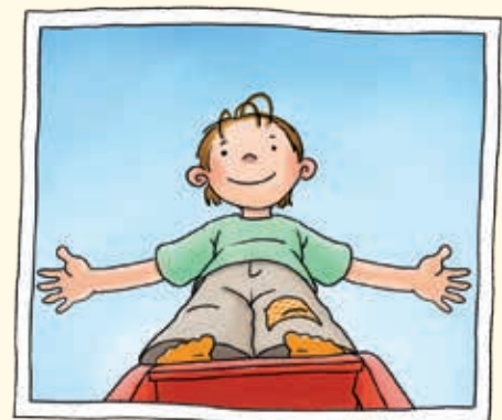
Untersicht / Froschperspektive